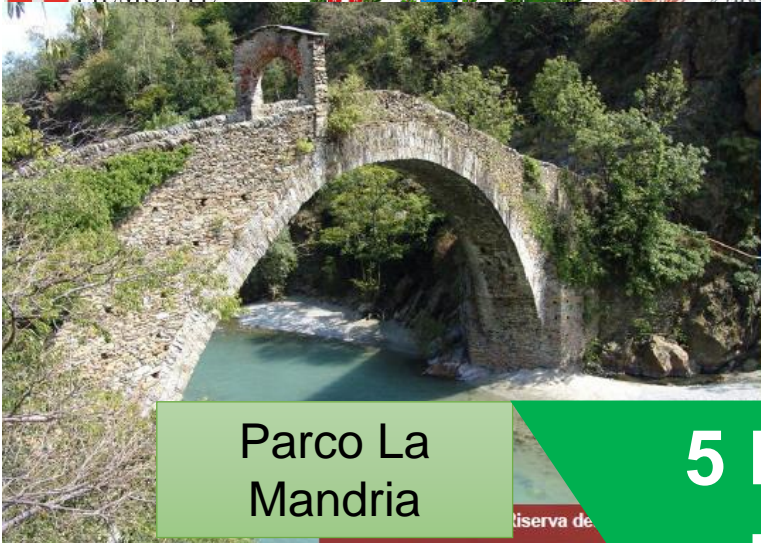
Parco La Mandria