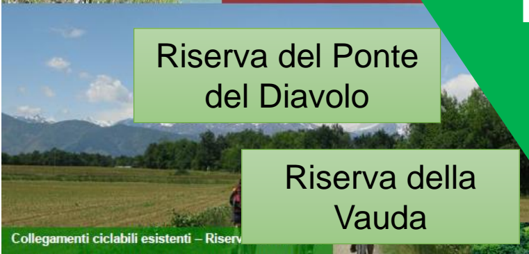
Riserva del Ponte del Diavolo

Reggia di Venaria Reale – Vista dai giardini