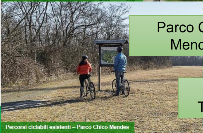
Parco Chico Mendes

Collegamenti ciclabili esistenti – Riserv