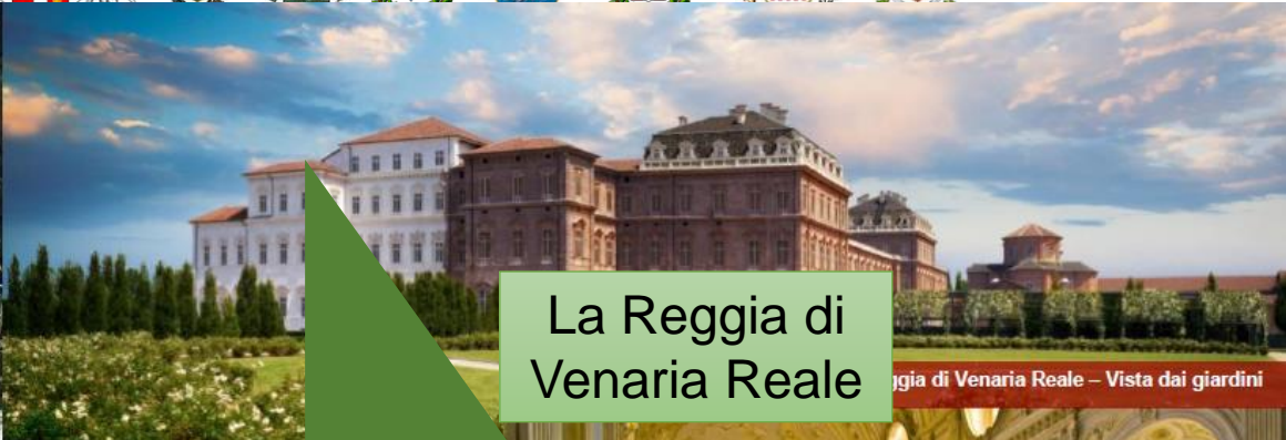
La Reggia di Venaria Reale

Reggia di Venaria Reale – Vista dai giardini