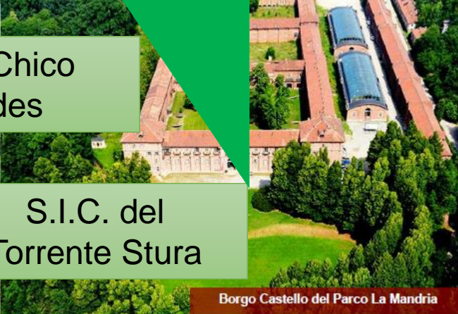
S.I.C. del Torrente Stura