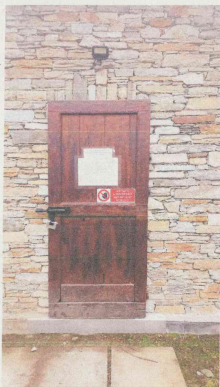
(Fotografia 4 - cartello indicatore dei termini relativi al DMV/DE)

Nel seguito vi segnaliamo i riferimenti ai quali inviare, in merito alla presente, la Vs. gradita corrispondenza: