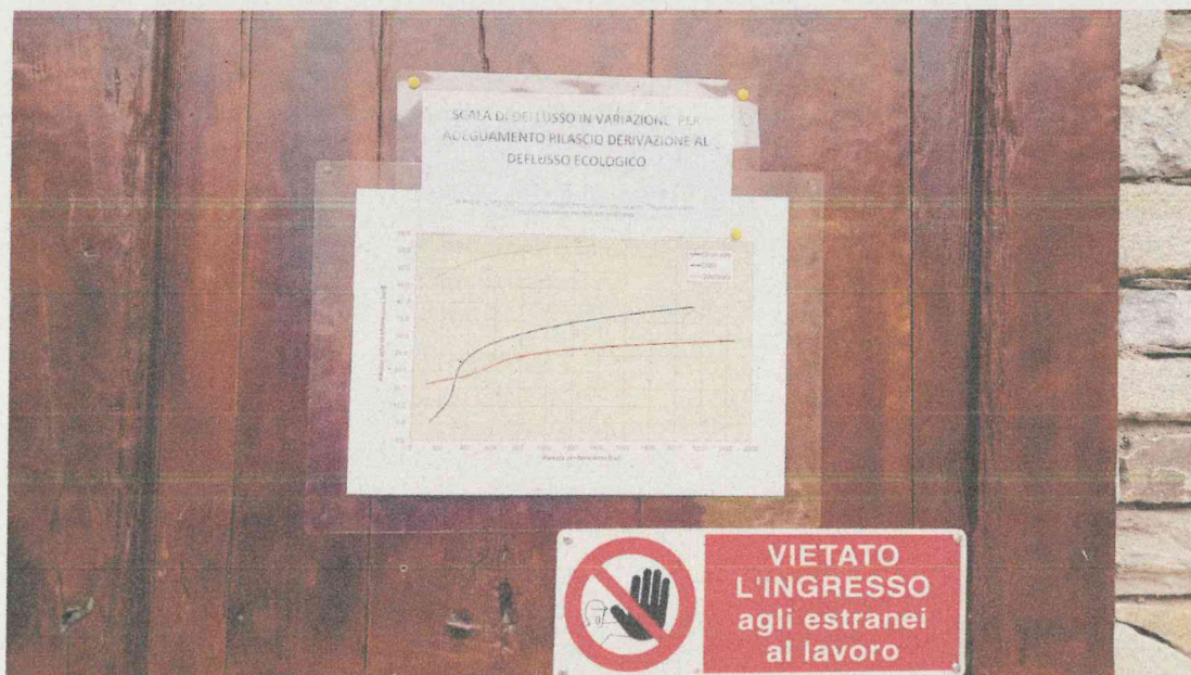
(Fotografia 3 - cartello indicatore dei termini relativi al DMV/DE)