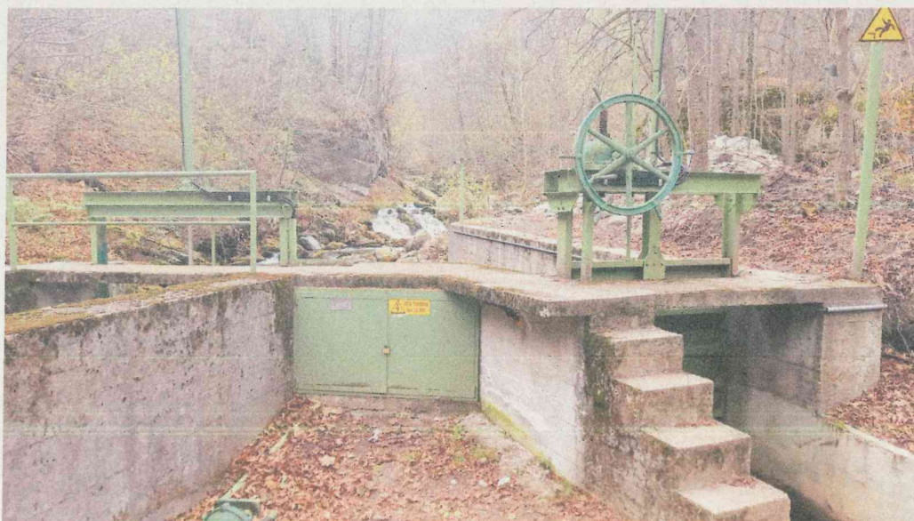
(Fotografia 2 - Targa derivazione, vista più ampia della sua posizione)

Per quanto riguarda invece, il cartello indicatore dei termini relativi al DMV/DE, esso non è ancora stato spostato come da prescrizione , (lo stesso sarà posizionato in prossimità dei manufatti di captazione posti in adiacenza all'alveo e in posizione visibile), perché la derivazione in oggetto fa parte delle derivazioni che dovranno, entro il 30 Giugno 2024, presentare il progetto di adeguamento alla regola definitiva di rilascio del Deflusso Ecologico, come previsto dal D.P.G.R 27 / 12 / 2021 n. 14 /R e successivamente adeguato entro il 22 Dicembre 2024. Pertanto allo scopo di renderlo pubblico e' stato applicato un cartello esplicativo che indica lo stato in "adeguamento" delle scale di deflusso (vedi fotografia n3 e n.4), La citata cartellonistica è attualmente in fase di rielaborazione sulla base dell'adeguamento delle opere preposte al rilascio secondo un progetto attualmente in fase di redazione. Sarà premura della scrivente trasmettere le fotografie del riposizionamento del suddetto e la revisione dello stesso secondo le nuove regole di rilascio. Come citato in precedenza la società scrivente ha dato in carico a professionista abilitato la progettazione dell'adeguamento al DE rispetto il DMV pertanto, a progetto di adeguamento approvato dagli enti preposti sarà posizionata come sopra descritto la nuova cartellonistica di riferimento.