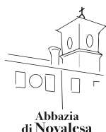
Abbazia di Novalesa