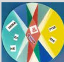
Immagine & Poesia