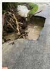
SP 103 km 7+200

CIRCA 28,5 MILIONI DI EURO DI DAMNI OLTRE 70 TRA PONTELE STRADE PROVINCIALI INTERROTTE OLTRE 90 COMUNI CHE HANNO DICHIARATO LO STATO DI EMERGENZA