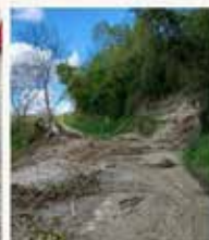
SP 99 km 5+500