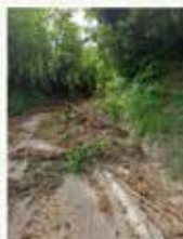
SP 106 km 1+700