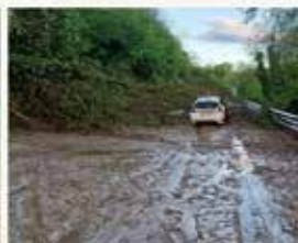
SP 590 km 20+000