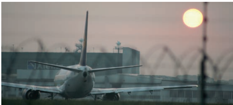
L'aeroporto di Caselle