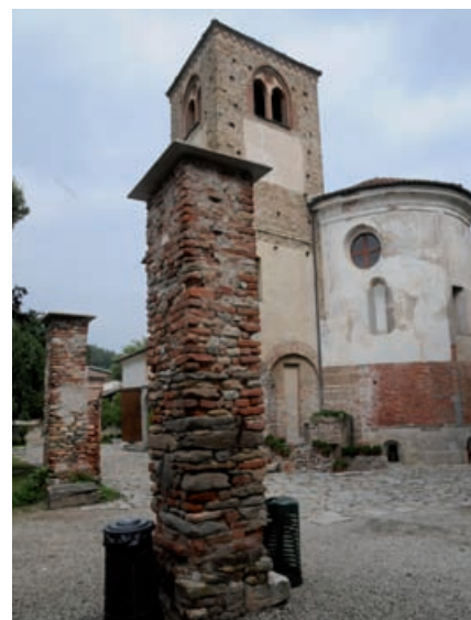
L'Abbazia di Santa Maria a Cavour