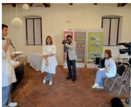
Gli studenti del Prever illustrano le proprietà delle mele