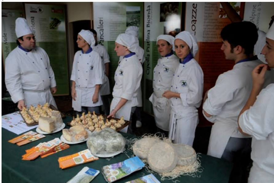
Gli studenti del Prever presentano i piatti a base di mele

inteso sensibilizzare sul tema della salvaguardia della qualità del cibo che viene somministrato tutti i giorni nelle mense scolastiche. Il coordinamento dell'evento, oltre che dalla Provincia di Torino, è stato curato da Slow Food e dalla Scuola Malva-Arnaldi, mentre la cooperativa "Il frutto permesso" ha fornito i prodotti per la degustazione, che è stata preceduta da una visita guidata all'Abbazia di Santa Maria, curata dalla Pro Cavour.