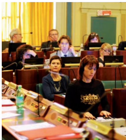
Aula del consiglio: le stenotipiste, dietro i consiglieri del PD

In merito al rischio idrogeologico dell'area, esaminando la carta di sintesi, ha continuato Saitta, è emerso che non c'erano pericoli che impedissero la costruzione su quella porzione di territorio. I problemi e i danni derivanti dai lavori di cantiere non sono di pertinenza della Provincia, ha concluso il Presidente, aggiungendo però che gli pareva opportuno che l'interpellanza e la risposta fossero inviate all'Ufficio di vigilanza della Regione Piemonte.