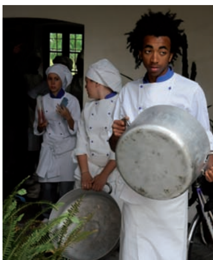
Gli studenti del Prever alla preparazione dei piatti a base di mele

L'iniziativa "Mele e dintorni" è stata dedicata ad una comunità locale da molti anni impegnata a valorizzare le proprie tipicità, soprattutto attraverso la manifestazione autunnale "Tuttomele". Gli studenti dell'istituto Agrario ed Alberghiero Prever sono stati coinvolti nella cucina e nel servizio, con un menù tutto rigorosamente a base di mele. Oltre a cucinare e servire i piatti, si sono cimentati nell'illustrazione agli ospiti delle caratteristiche di un prodotto a Km zero che, come le mele del Pinerolese, è strettamente collegato al territorio ed alle sue tradizioni agricole e culinarie. All'evento sono intervenuti amministratori locali, dirigenti scolastici e giornalisti, che la Provincia ha