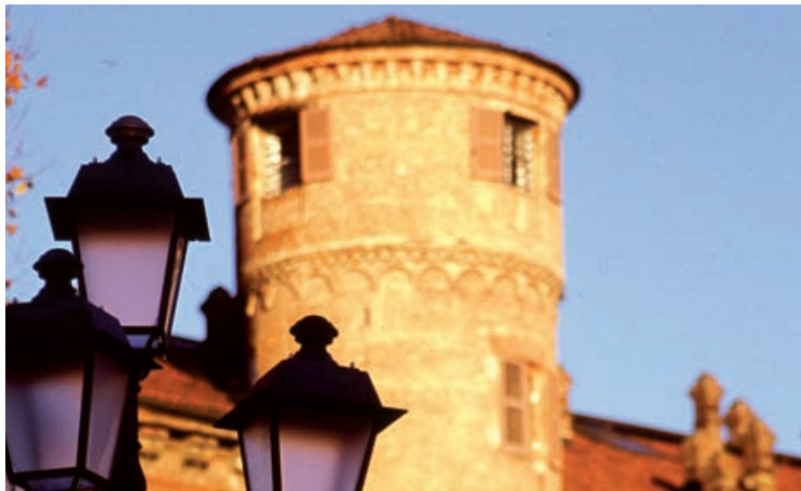
Il castello di Moncalieri

che, pertanto, non sono state prese in considerazione. Le differenze tra quanto previsto dal progetto preliminare e da quello definitivo del PTC sono dovute agli approfondimenti tecnici. La classificazione del sistema viario di adduzione alla città di Torino è stata affrontata in modo globale per l'intera area metropolitana; essa è mutata nel passaggio tra preliminare e definitivo per ragioni tecniche. La classificazione del centro storico di Moncalieri non è mutata, così come quella dell'area di Strada Carpice, che dovrebbe ospitare il nuovo ospedale.