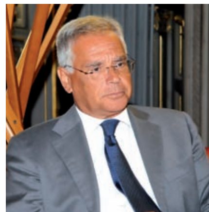
Il nuovo prefetto Alberto Di Pace

Ha prestato servizio nelle prefetture di Sondrio e di Brescia, e, successivamente, al Ministero dell'Interno e al Ministero degli Affari Esteri. Tra il 1993 e il 1994 ha ricoperto l'incarico di Vice Capo di Gabinetto al Ministero dell'Ambiente. Dal 1995 al 2000 è stato a capo della Direzione Centrale della Protezione Civile e dei Servizi Logistici del Viminale, e ha diretto l'Unità Nazionale di Gestione per il problema del Millennium Bug. È stato prefetto di Siracusa (2000), di Catania (2000-2003) e di Catanzaro (2003-2005), e, quale Commissario dello Stato per la Regione Siciliana (2005-2009), autorità competente a impugnare le leggi siciliane dinanzi alla Corte Costituzionale.