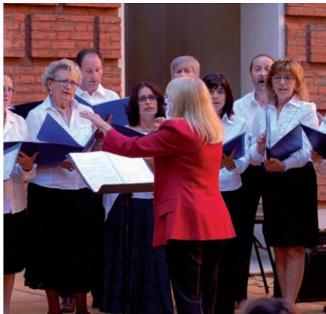
I Cantori di Osasio