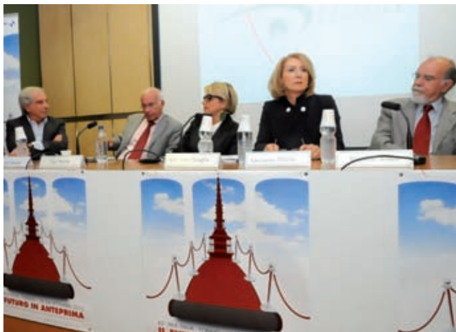
La presentazione del Prix Italia

Fra gli ospiti "speciali", lunedì 20 settembre, in collaborazione con il Museo del Cinema, vi sarà al Teatro Carignano una performance del regista anglosassone Peter Greenaway, che fa rivivere alcuni dei più famosi capolavori dell'arte figurativa attraverso l'uso dei linguaggi cinematografici, musicali e della tecnologia.