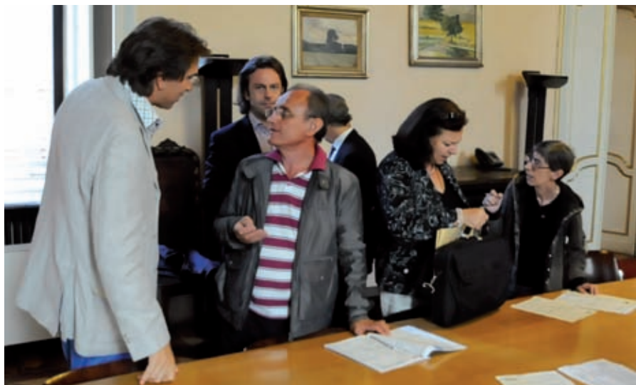
La III Commissione al lavoro