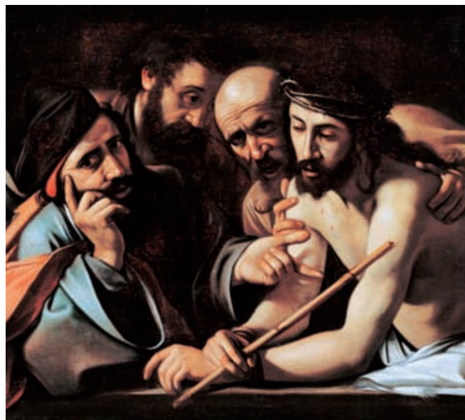
Ecce Homo opera di Caravaggio