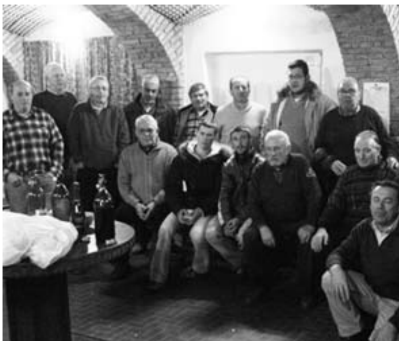
Il coro Bajolese

Questo patrimonio costituisce un fattore rilevante rispetto alla diversità culturale e la sua salvaguardia garantisce la conservazione delle espressioni culturali proprie di ogni singolo contesto sociale, che concorrono a formare quella che comunemente si definisce "tradizione".