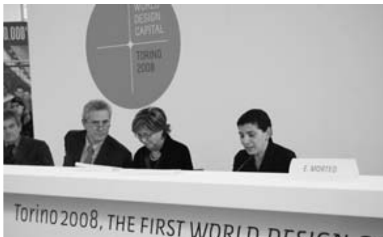
Il sindaco Chiamparino, il ministro Rutelli, la presidente Bresso e l'assessore De Santis

In particolare a Ivrea si è scelto di ripercorrere una storia di successi tecnici, commerciali e di immagine come quella dell'Olivetti (basti pensare alla "Lettera 22", esposta al MOMA di New York), con un atteggiamento non rivolto esclusivamente a un passato irripetibile ma proiettato verso il futuro e l'innovazione.