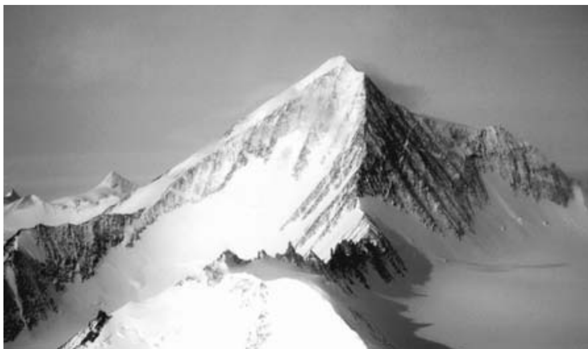
Il monte Vinson

Il Massiccio del Vinson, la cui vetta dista 1190 km dal Polo Sud, si solleva dal Nimitz Glacier. Il monte deve il suo nome a Carl Vinson, un deputato americano della Georgia. Fu scoperto nel 1957, a seguito di un avvistamento aereo; è stato scalato per la prima volta nel dicembre del 1966 da un gruppo misto del Club Alpino Americano e della National Science Foundation.