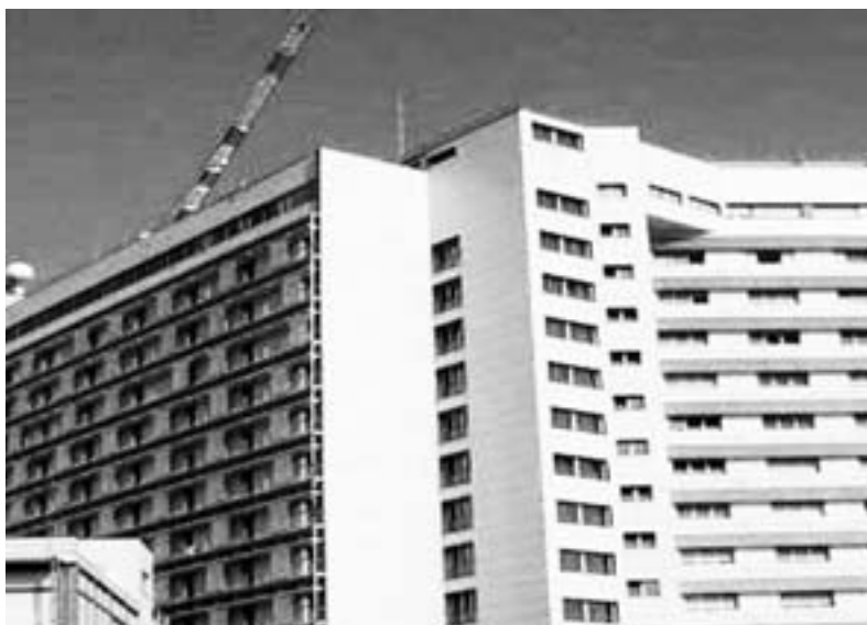
Sarà così la Città della Salute?