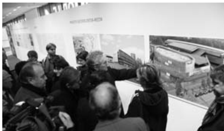
Il ministro Rutelli visita la mostra