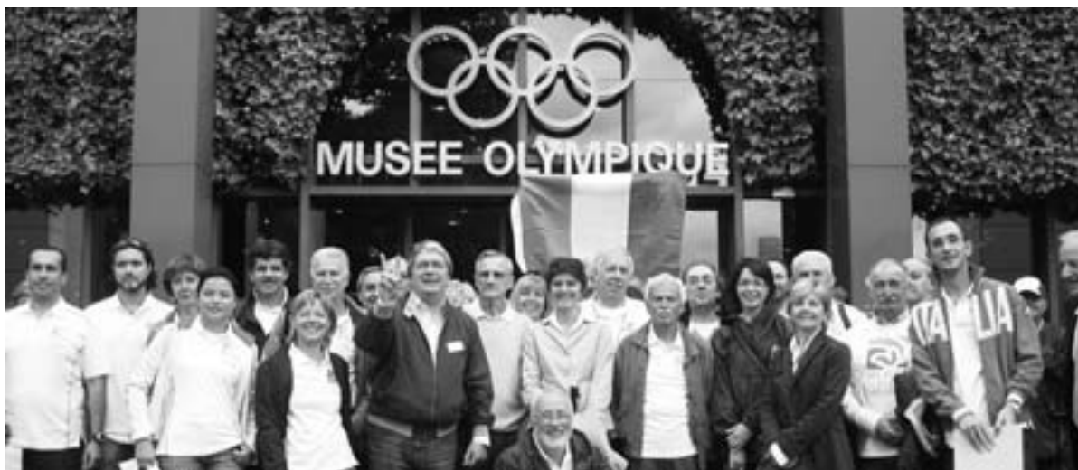
La delegazione italiana davanti al Museo Olimpico di Losanna