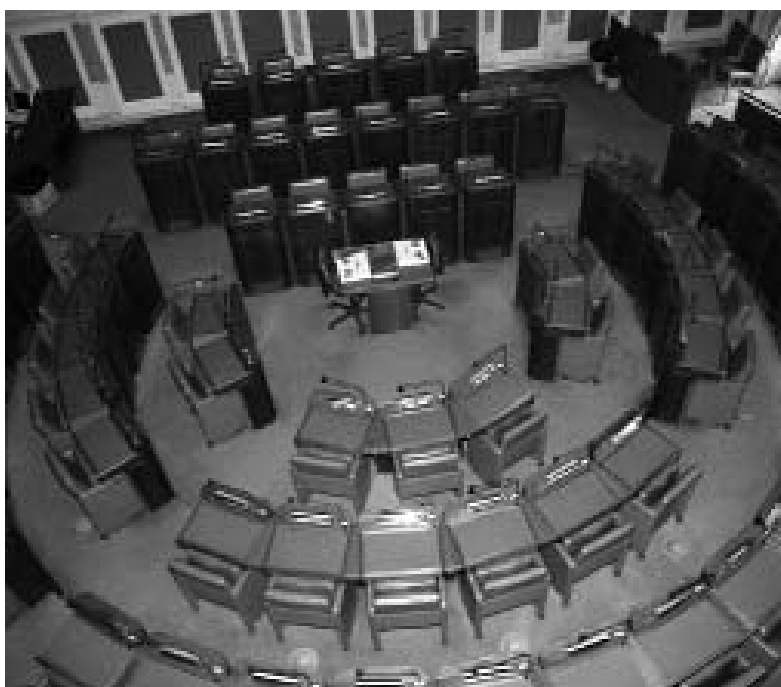
L'aula "Elio Marchiario"