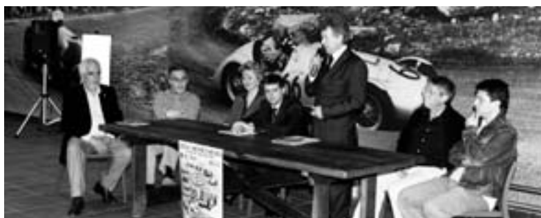
La presentazione della Susa Moncenisio

Da registrare il nuovo record di iscritti alla gara piemontese: nelle tre specialità (Velocità in salita, Autostoriche e Slalom) oltre 200 i concorrenti che si sono dati appuntamento a Susa per la “corsa più antica del mondo”.