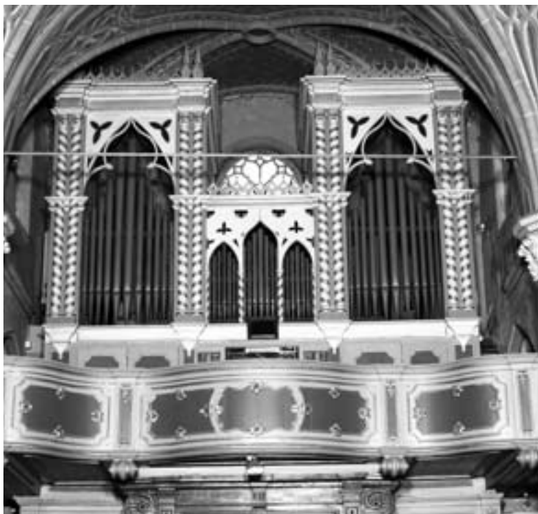
L'organo Bernasconi a Volpiano

fissato alle 21.15 mentre l'ingresso, come sempre, è libero e gratuito. Per ogni ulteriore informazione: www.organalia.it