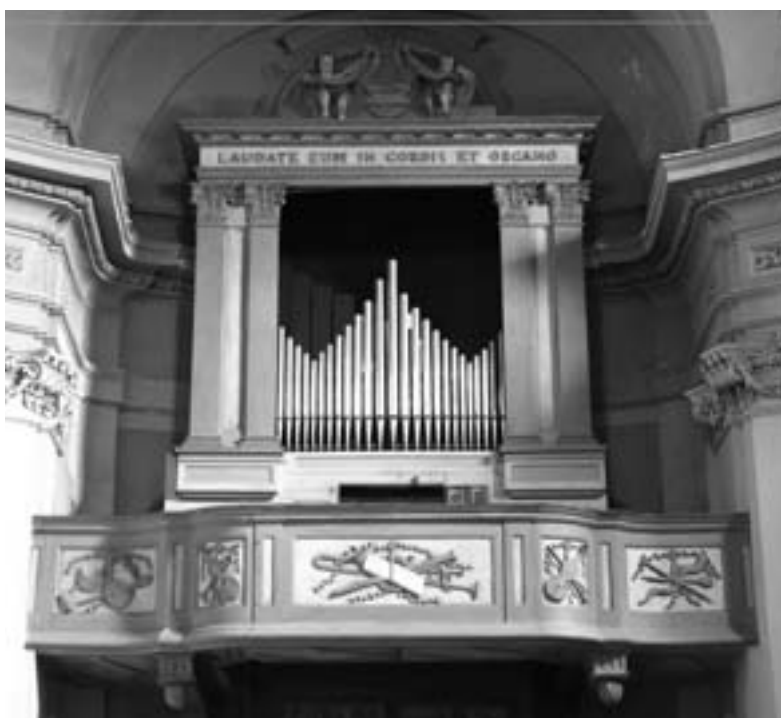
L'organo Bossi a Volpiano