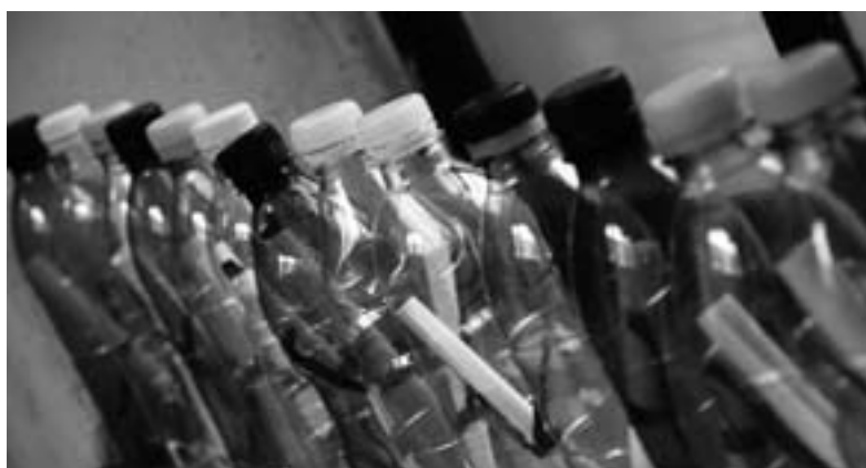
I lavori dei ragazzi delle scuole che hanno aderito al progetto