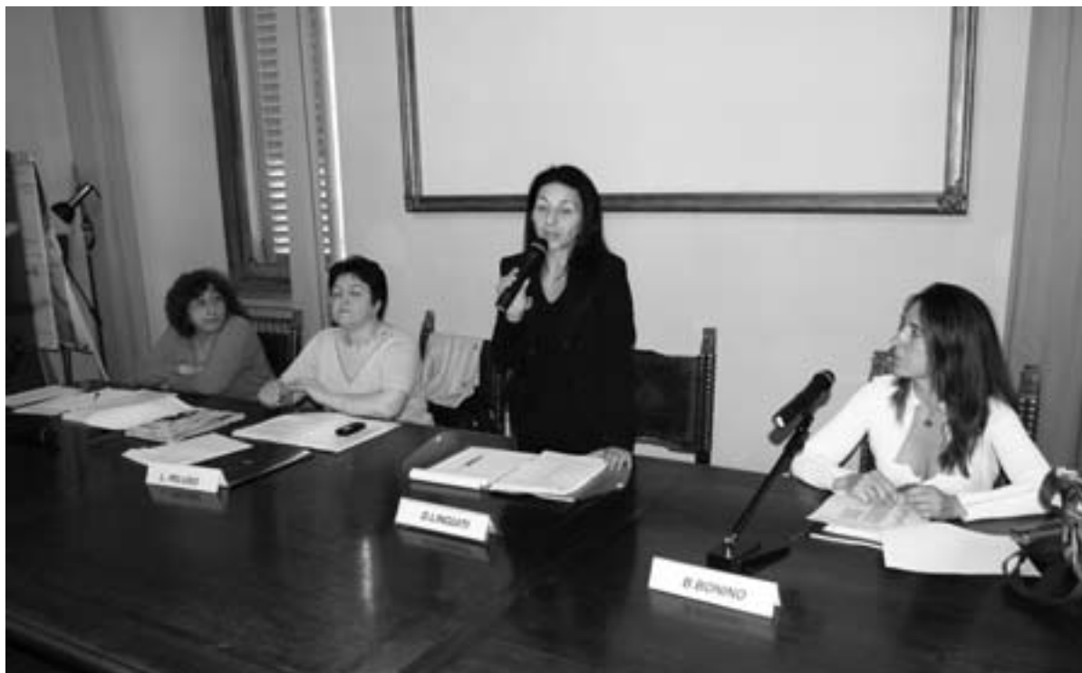
La sottosegretaria Linguiti all'incontro

Deputati dal titolo "Misure di sensibilizzazione e prevenzione, nonché di repressione dei delitti contro la persona nell'ambito della famiglia, per l'orientamento sessuale, l'identità di genere ed ogni altra causa di discriminazione". È stata inoltre presentata la proposta di legge regionale di iniziativa popolare per l'istituzione di Centri antiviolenza che prevede la creazione di "Case segrete", una risposta al dirompente fenomeno di drammatica attualità costituito dai maltrattamenti e dalle violenze nei confronti delle donne. La Sottosegretaria Donatella Linguiti ha rimarcato l'importanza del ruolo degli Enti locali in materia di diritti alle pari opportunità, "Un ruolo fondamentale per agire direttamente sul territorio e fornire risposte concrete su una materia così socialmente determinante e delicata".