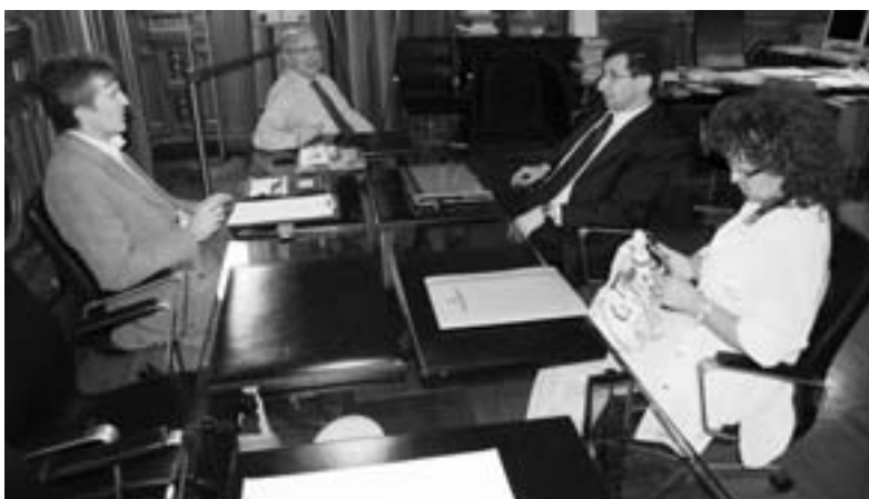
Il sindaco e il vicesindaco di Cercenasco

scolastica (la popolazione dei bimbi in età scolare è in crescita a Cercenasco): il Comune ha già previsto un investimento di 300.000 euro, ma un contributo sarebbe gradito.