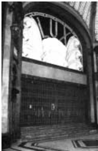
Quale futuro per il Cinema Lux?