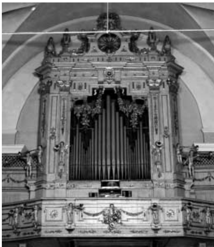
L'organo Vegezzi Bossi della parrocchia di Montanaro.

Il celebre concertista, già organista dell'Orchestra sinfonica nazionale della Rai, eseguirà brani di Bach, Bossi, Franck, Saint Saens,