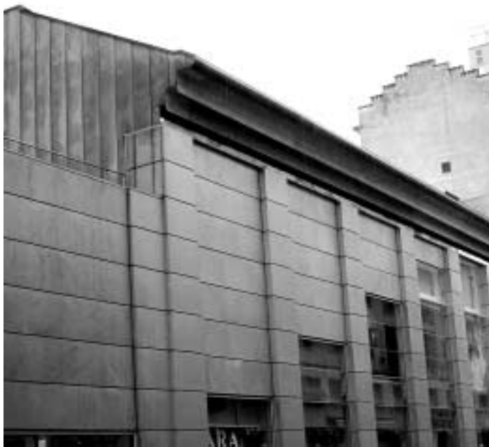
Dove un tempo c'era il Cinema Vittoria, oggi c'è un'altra multinazionale dell'abbigliamento