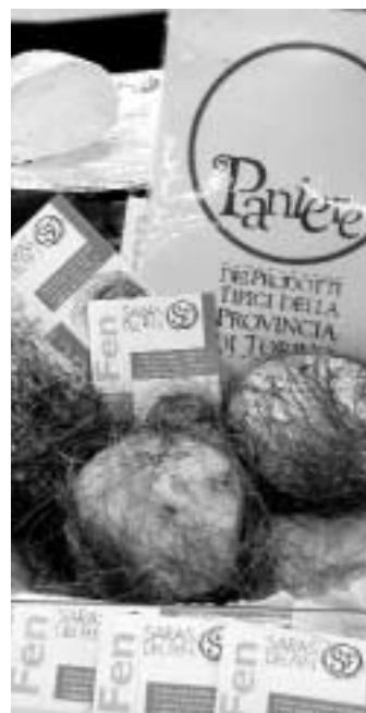
Il Paniere della Provincia.

Nelle piazze, nei cortili o sotto il tendone del Circo si terranno gli spettacoli conclusivi del Festival delle Province, il primo festival nazionale di cultura popolare". Saranno di scena, tra gli altri, le tarantelle d'amore di Ambrogio Sparagna, i canti a braccio dei pastori-poeti dell'Alto Lazio e i pupi catanesi della famiglia Grasso.