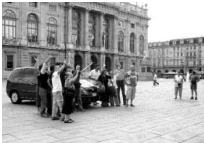
Partenza della missione per la Bielorussia.

Il convoglio umanitario è partito il 26 agosto.