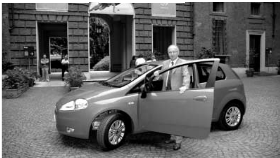
Il Presidente Saitta prova la Grande Punto.

questa vettura, sono sicuro, rilancerà l’insediamento torinese della Fiat, garantendo un futuro sereno ai lavoratori. – aggiunge Saitta – vanno in questo senso le incoraggianti dichiarazioni dell’amministratore delegato del gruppo, Sergio Marchionne, il quale ha escluso la chiusura di stabilimenti in Italia e preannunciato un’intesa strategica con un partner industriale europeo”.