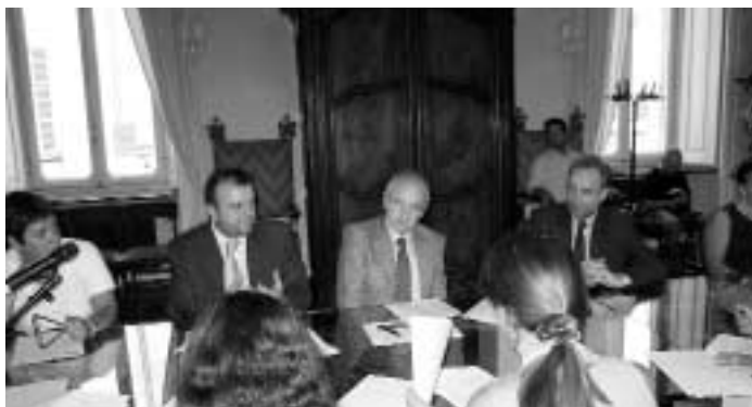
Presentazione anno scolastico 2005/2006.

"In provincia di Torino - continua D'Ottavio - ci sono 95 Istituti superiori dislocati in 160 edifici,