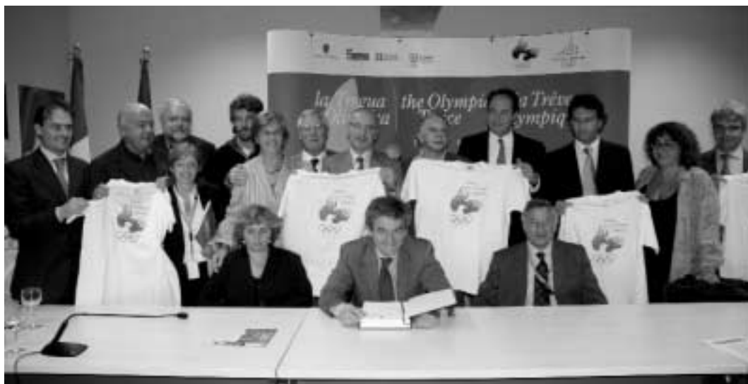
Firma della tregua olimpica.

Gli interessati possono iscriversi fino ai primi giorni di ottobre, compilando e spedendo la scheda scaricabile dal sito www.ragazzidel2006.it alla segreteria organizzativa Ragazzi del 2006 della Provincia, via Maria Vittoria 12, 10123 Torino, oppure compilando la scheda presso gli sportelli del Progetto "I Ragazzi del 2006" a Cirié, Collegno, Ivrea, Lanzo, Moncalieri, Oulx, Pinerolo, Susa, Settimo Torinese (indirizzi e orari sul sito www.ragazzidel2006.it ).