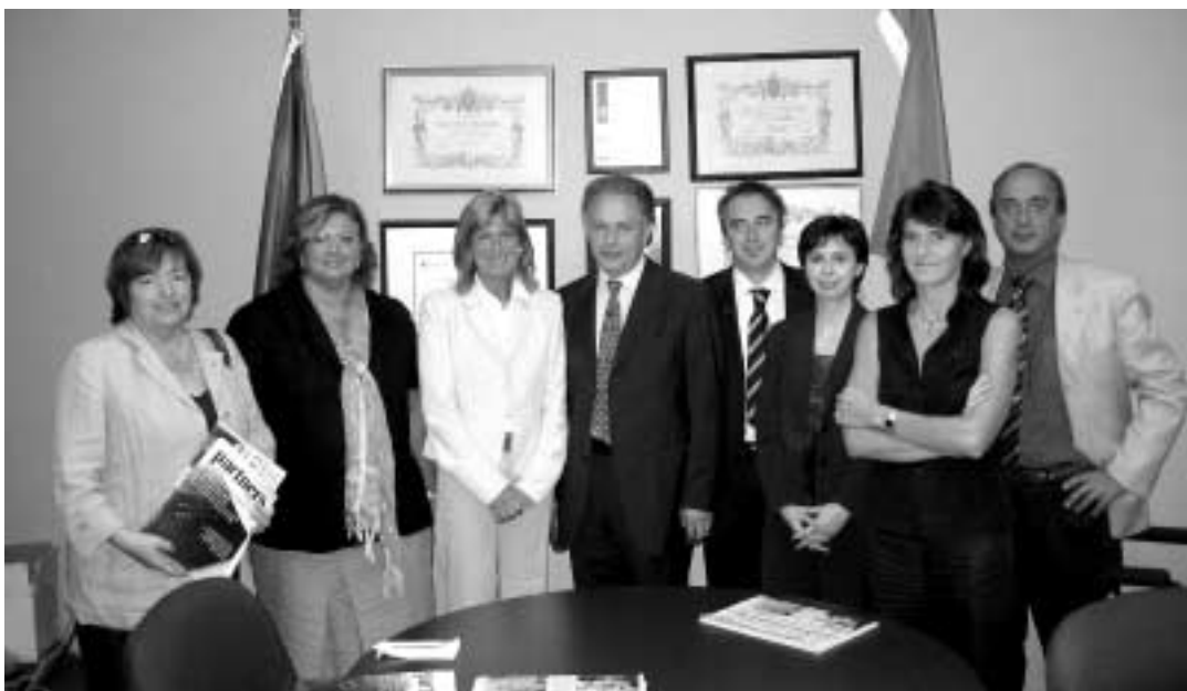
La delegazione piemontese a Toronto.

Si tratta di un discorso che va proseguito, sempre in collaborazione con la Città di Torino, con la Regione e con la Camera di commercio”.