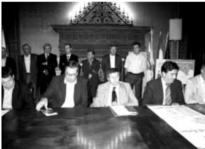
Presentazione Festa dell'uva.

bre alle 20,30 è in programma la sfilata di apertura della manifestazione con partecipazione della banda musicale di Caluso, della Ninfa 2004, dei rioni e delle frazioni nelle vie del centro storico. A partire dalle 21, nelle restaurate cantine settecentesche di Palazzo Valperga Masino, sarà aperta al pubblico l'Enoteca Regionale dei Vini della Provincia di Torino. Alla presenza della Ninfa 2004 e del Consiglio Grande della Credenza vinicola si inaugureranno i banchi d'assaggio dei produttori vitivinicoli, con la partecipazione dei Consorzi di valorizzazione e tutela vini Doc della Provincia di Torino. La Città di Caluso riceverà il riconoscimento quale migliore Festa dell'uva della Provincia di Torino. Nel Parco Spurgazzi, nell'ambito del progetto "Sentiero DiVino in vendemmia", il Teatro delle Forme presenterà Enrico Bonavera nello spettacolo "I Segreti di Arlecchino". Sabato 17 settembre alle 17, sempre nei locali dell'Enoteca regionale dei vini della Provincia di Torino, si terrà la premiazione del concorso vitivinicolo "Grap-