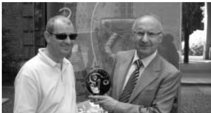
Saitta e Vigliaturo.