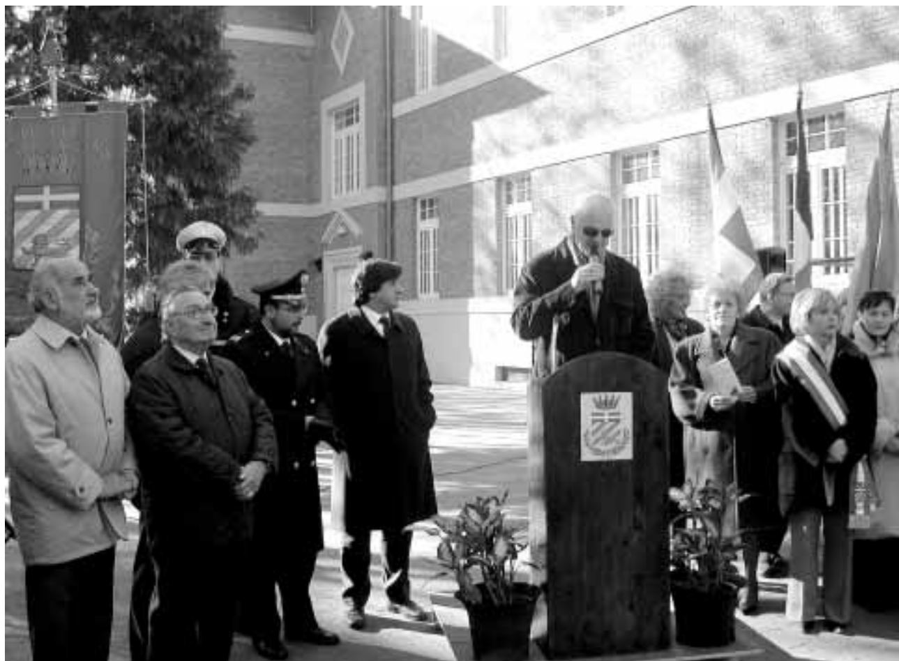
Inaugurazione Marie Curie, Grugliasco.

Completati importanti interventi in tutto il territorio provinciale. Attività in corso in 21 cantieri