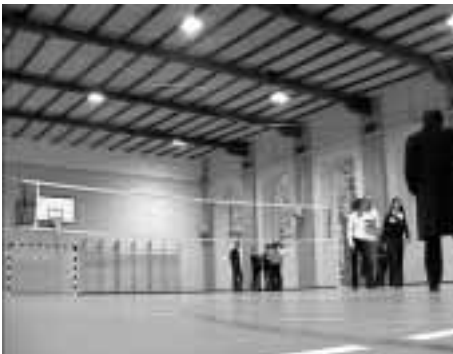
La palestra del Porporato.

di trasformare da succursale a sede effettiva del liceo non appena i parametri necessari, a partire dal numero degli studenti (superiore a 500), lo consentiranno. A questo scopo è già in programma l'approvazione del progetto per ristrutturare un'altra palazzina del Parco".