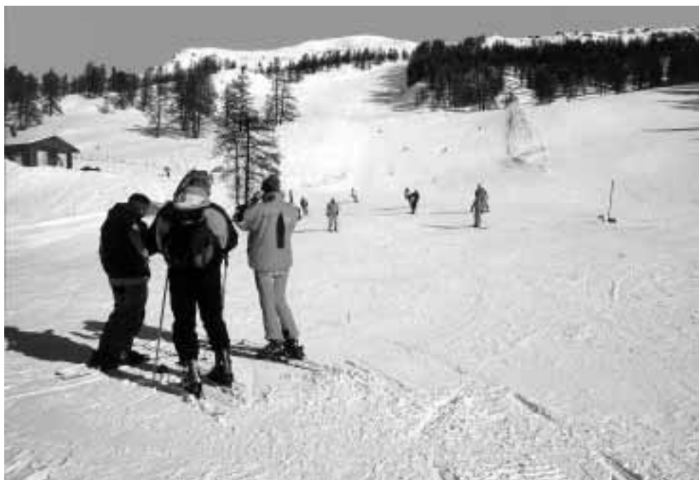
Sansicario, piste e sciatori.

Il contributo concreto della Provincia ai Comitati organizzatori locali degli Sport Events consiste in servizi ed eventi il cui valore di mercato supera il milione di euro: il catering con i prodotti del "Paniere", le esibizioni dei gruppi folkloristici i servizi giornalistici e multime-