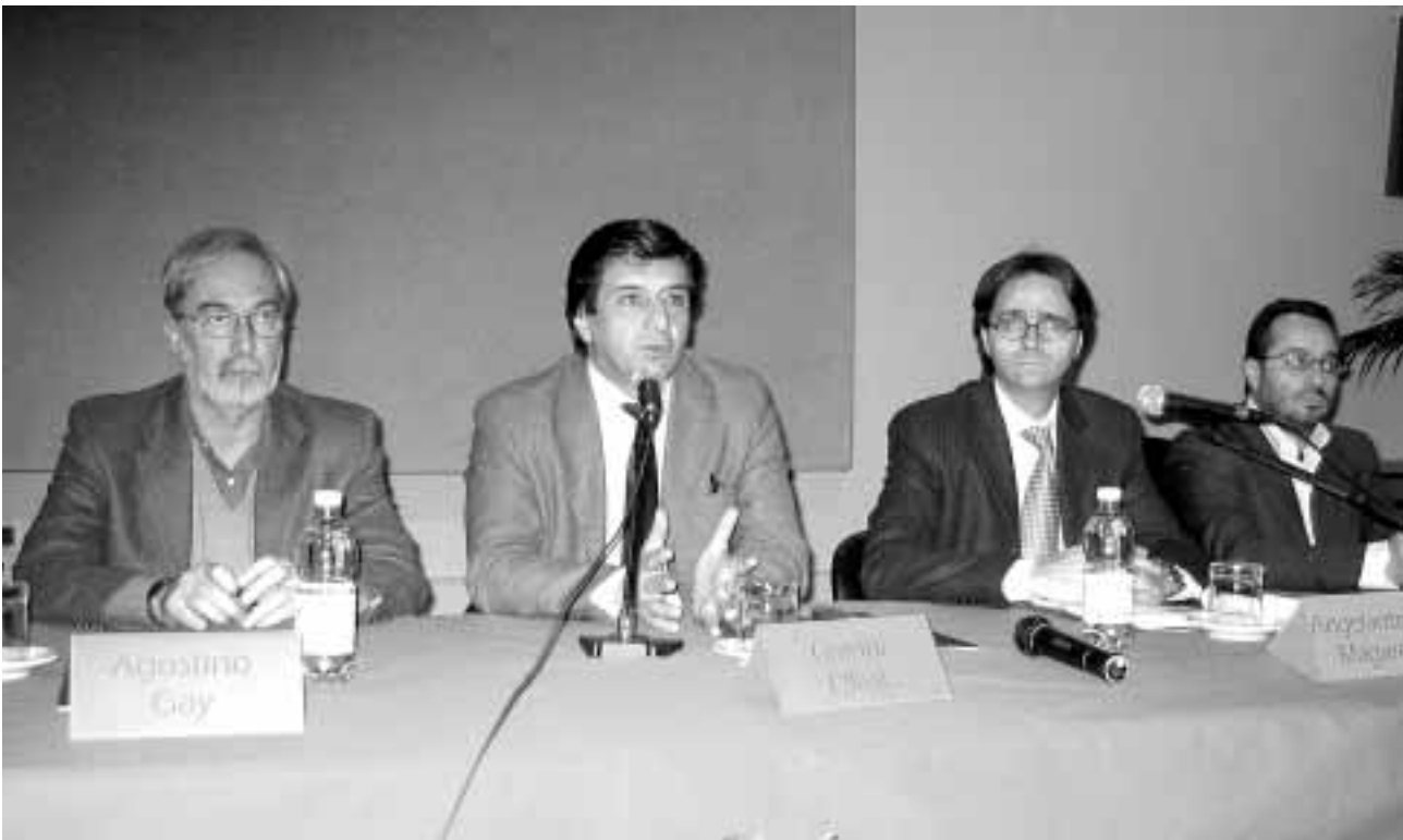
Oliva, presentazione progetto Vittone.

Per quanto riguarda la gestione della manutenzione, oltre ad erogare i servizi ordinari e a provvedere alle richieste di ripa-