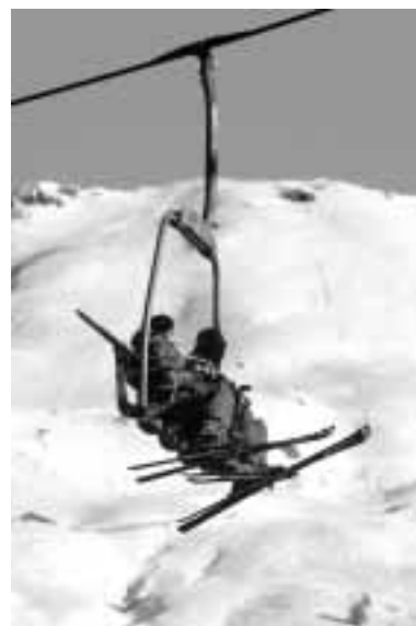
Sestriere, seggiovia.