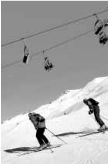
Sauze d'Oulx, impianti e sciatori.