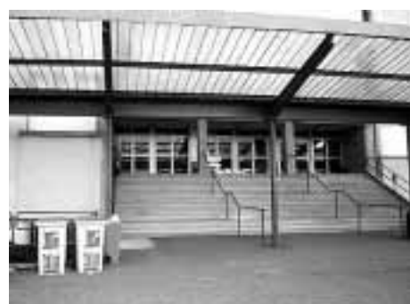
Ingresso scuola Vittone.

portanza particolare rispetto alla tipologia dell'edificio. Siamo riusciti a coniugare la difesa dell'identità storica con le soluzioni più innovative per l'utenza scolastica". L'intervento ha interessato una superficie di circa 10.000 m 2 ed è in grado di ospitare 40 aule (per un totale di poco inferiore a 1000 studenti) con uffici, laboratori, aule computer, biblioteca e palestra. Giunta a buon fine anche la creazione della sezione staccata del Liceo Scientifico socio-psico-pedagogico e linguistico "Marie Curie" di Grugliasco all'interno del Parco Dalla Chiesa di Collegno. La scuola è ospitata nella Villa 4, costruita attorno