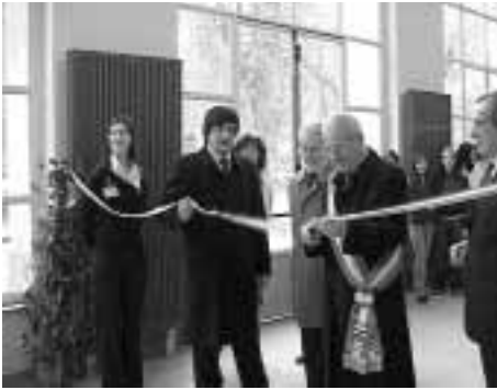
Inaugurazione liceo Porporato, ex Fenulli.