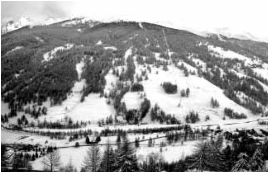
Val Tronca, panoramica.

diali della Map, la Media Agency Provincia di Torino. Il "Paniere" è una delle risorse su cui la Provincia punta per "fare notizia" durante gli Sport Events.