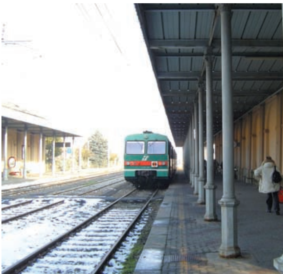
Stazione di Pinerolo - Qui sono giunti i consiglieri provinciali viaggiando sul treno Torino-Pinerolo (a pag. 13 e a pag. 19)

Il lavoro non è salutare Agenda 21, le donne protagoniste Torino-Pinerolo, il treno dei desideri?