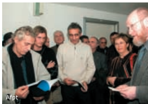
Afpt Inaugurazione del Corridoio dell'arte