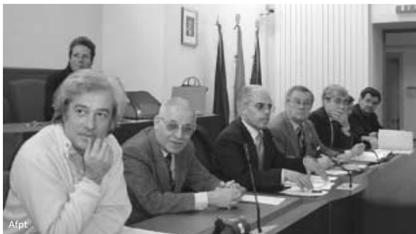
Consiglieri e amministratori al tavolo dell'incontro