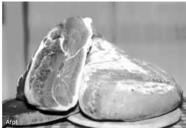
Il prosciutto della Valsusa