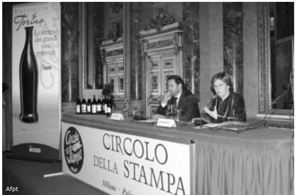
Bresso e Bellion presentano la "Bottiglia Torino" ai giornalisti milanesi

Mercoledì 21 gennaio, presso la Sala napoleonica del Circolo della Stampa di Milano la presidente della Provincia Mercedes Bresso e l'assessore all'agricoltura Marco Bellion hanno presentato la Bottiglia Torino a decine di giornalisti di testate del settore vitivinicolo, del turismo, dell'enogastronomia e dei maggiori quotidiani milanesi. "La Bottiglia Torino - ha osservato Mercedes Bresso - ha lo scopo di offrire ai vini di qualità del nostro territorio una forma adeguata a esprimerne l'eccellenza e, al tempo stesso, uno strumento per promuoverne la commercializzazione". "La bottiglia - ha aggiunto Bresso - rappresenterà un premio per i produttori; un distintivo per i vini che metaforicamente lo indosseranno e al tempo stesso una garanzia per i consumatori che chiedono sicurezza e qualità nei prodotti". "Siamo certi - ha concluso la Presidente - che l'eleganza della confezione offrirà una spinta forse decisiva all'affermazione definitiva dei nostri vini migliori". Successo della degustazione dei prodotti tipici e dei vini selezionati della provincia di Torino.