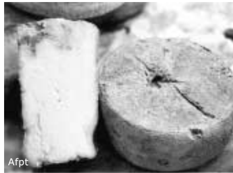
Rubatà e la toma del lait brusc