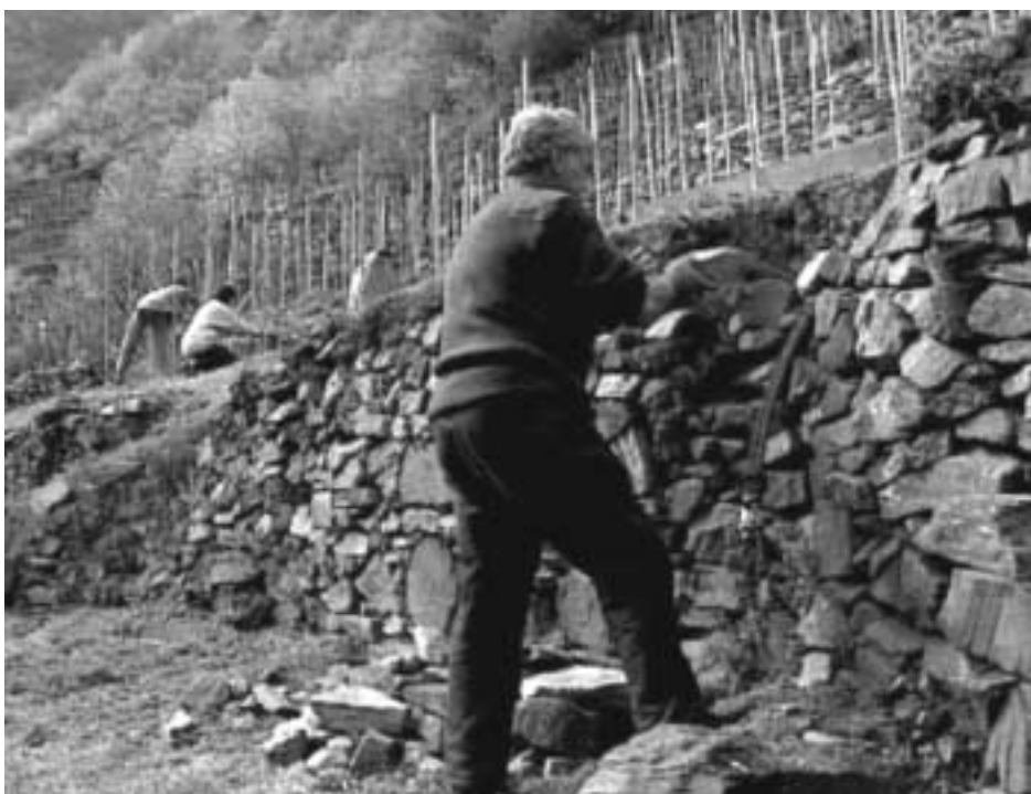
Ripristino di muri a secco in una vigna di montagna

Nasce l'associazione "Video Archivio Mestieri della Montagna" o più semplicemente "VAMM" che ha come scopo il reperimento, l'archiviazione e la diffusione di materiali video (esistenti o da realizzare ex novo) relativi alle più disparate lavorazioni artigianali tradizionali delle aree alpine europee. È costituita da tre soci, le Province di Torino e di Trento e l'Associazione Prealpina. Sono in corso contatti per allargare l'associazione a nuove province con l'intento di avviare un'estensione che preveda il raggiungimento di tutto l'arco alpino ed appenninico e i versanti d'oltralpe. Con questo tipo di partecipazione l'iniziativa potrebbe aprirsi verso una cultura europea della montagna, vero, grande traguardo finale dell'operazione.