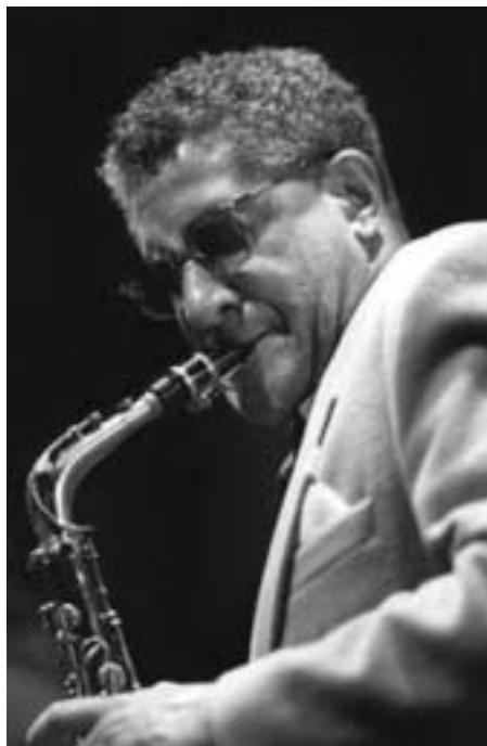
Gary Bartz al saxofono