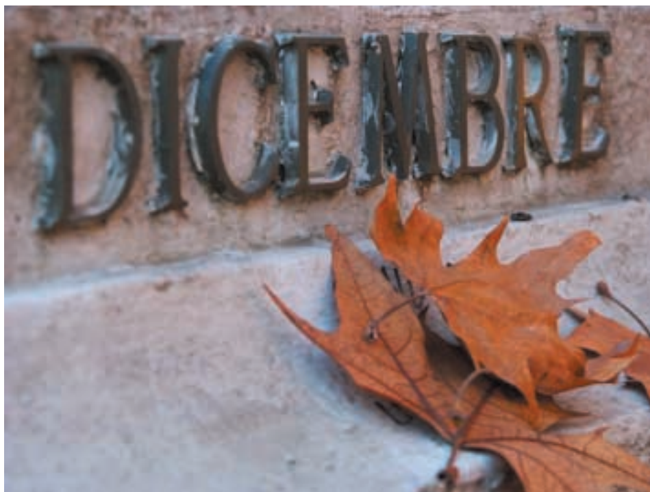
Maurizio Pichierrri - Dicembre della fontana Un particolare molto autunnale per la più famosa fontana di Torino

Speciale "Primo piano sul Consiglio Provinciale"