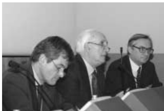
Il sindaco Chiamparino, l'assessore Buzzigoli e Arzeni del Comitato scientifico

Circa 1500 persone, tra partecipanti e relatori, al primo Salone dello Sviluppo Locale che si è tenuto a Torino, presso il Centro Congressi Torino Incontra, il 27 e il 28 novembre. La manifestazione ha raggiunto il culmine nel pomeriggio di giovedì 27 quando Amartya Sen, premio Nobel per l'economia