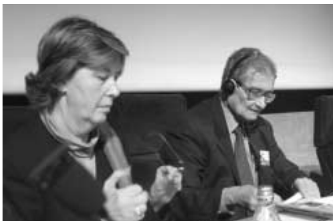
La presidente Bresso e Amartya Sen

del 1998, ha esposto le proprie tesi sulle possibili evoluzioni dei processi riguardanti lo sviluppo locale. Ma anche prima e dopo, il Salone è stato frequentato da ospiti prestigiosi; tra gli altri Giuseppe De Rita, Alessandro Profumo, Sergio Arzeni, Arnaldo Bagnasco e Charles Sabel fino all'intervento conclusivo di Alain Touraine. "Grazie ai numerosi workshop del Salone - commenta Antonio Buzzigoli, assessore alla Concertazione territoriale - nessun tema concernente lo sviluppo locale è stato trascurato: dalle politiche economiche ai processi di governance; dall'internazionalizzazione allo sviluppo sostenibile; dalle scuole di formazione ai processi per la creazione d'impresa. Sono state due giornate ricche di eventi". Ma non di soli workshop ha vissuto il Salone. Contemporaneamente alle sessioni di lavoro, infatti, presso i locali del