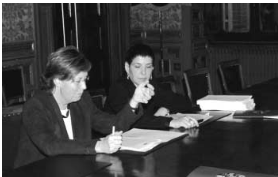
La presidente Bresso e l'assessore De Santis alla conferenza stampa

Neppure per il 2004 ci saranno aumenti su imposte, tasse e addizionali di competenza provinciale. Lo hanno annunciato la presidente Mercedes Bresso e l'assessore al Bilancio Giuseppina De Santis presentando a Palazzo Cisterna il bilancio di previsione per il 2004. "Un bilancio difficile – hanno osservato la presidente e l'assessore – per effetto delle norme contenute nella legge finanziaria dello scorso anno. I trasferimenti dallo Stato non sono stati adeguati all'inflazione, gli aumenti contrattuali per i dipendenti ricadranno integralmente sul bilancio degli Enti locali, il federalismo fiscale è poco più che uno slogan. Ma nonostante le tensioni siano forti, e concentrate soprattutto sulla spesa corrente, siamo riusciti ancora una volta a non aumentare le imposte". "Anche per gli investimenti, – aggiungono Bresso e De Santis – ci sono alcune difficoltà. Da due anni ormai, per esempio, la Regione non ci trasferisce le risorse per l'alluvione 2000: abbiamo anticipato 7 milioni di euro, ma finora non ci sono stati rimborsati". "Nonostante i problemi – annotano ancora le due amministratrici – ci siamo sforzati di utilizzare al meglio le risorse mantenendo chiari gli obiettivi: da un lato non ridurre in modo ingiusto i