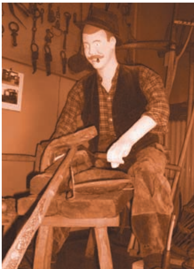
Renato Crivello Manichino del montanaro intento a lisciare il manico del rastrello Museo di Cultura Popolare e Contadina di Villastellone

Flotte pubbliche avanti tutta Una vendemmia miracolosa Festa al liceo Porporato