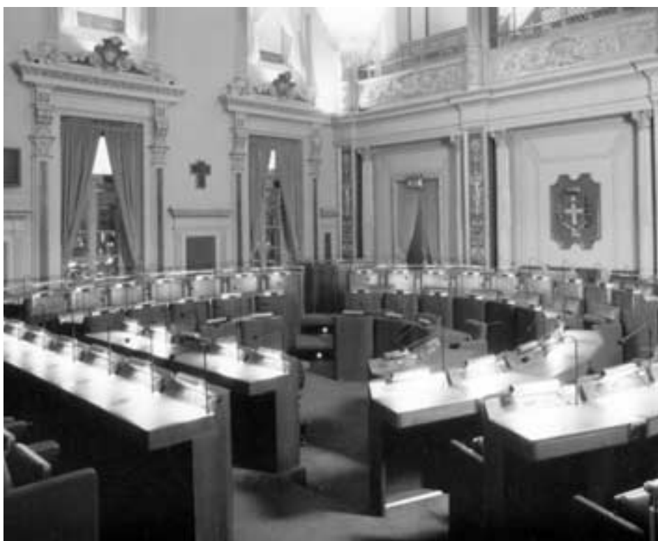
Aula del Consiglio