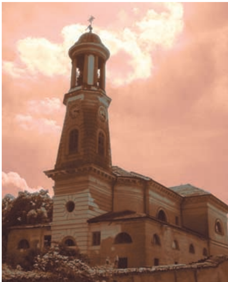
Renato Crivello Chiesa della Madonna dei Dolori a Borgo Cornalese nel Comune di Villastellone