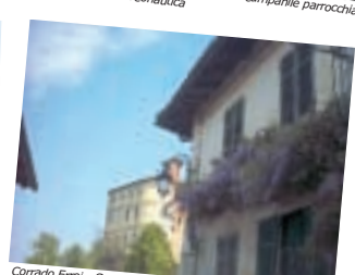
Corrado Erri - Scorcio del castello di Pralormo