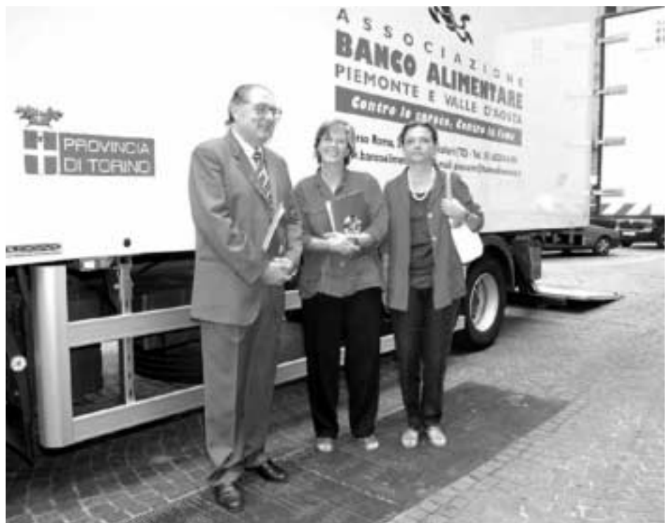
Carità, Bresso e Brunato inaugurano il camion