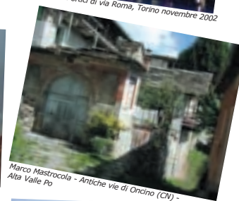
Marco Mastrocola - Antiche vie di Oncino (CN) - Alta Valle Po