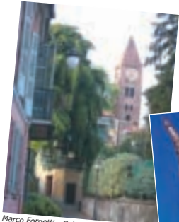
Marco Fornetti - Salendo al castello di Rivoli - aprile 2003

Questa settimana proponiamo le foto già pubblicate sul web nella sezione "Strade".