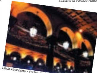
Dario Pintabona - Portico di via Roma, Torino novembre 2002