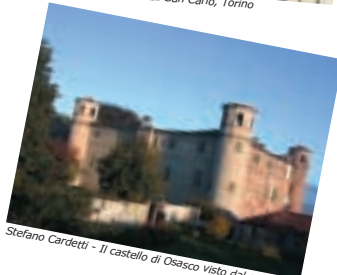
Stefano Cardetti - Il castello di Osasco visto dal centro storico