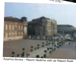
Rosanna Novara - Palazzo Madama visto da Palazzo Reale