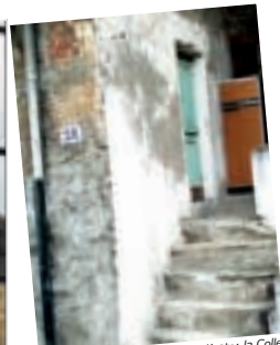
Bruno Zucca - Collegno dimenticata: la Collegno storica sull'orlo del terrazzo della Dora