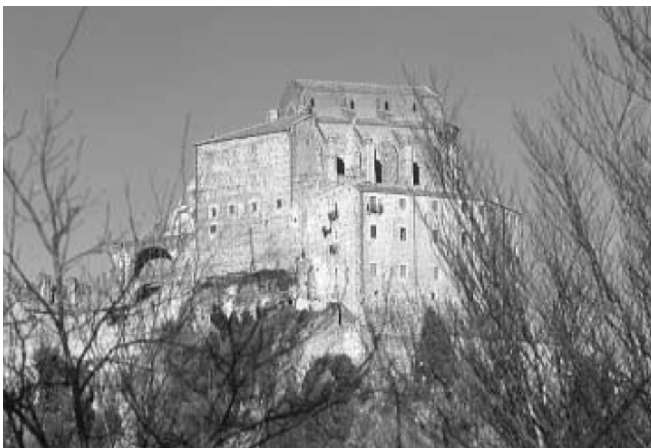
Sacra di S. Michele. Lavori sulla diramazione