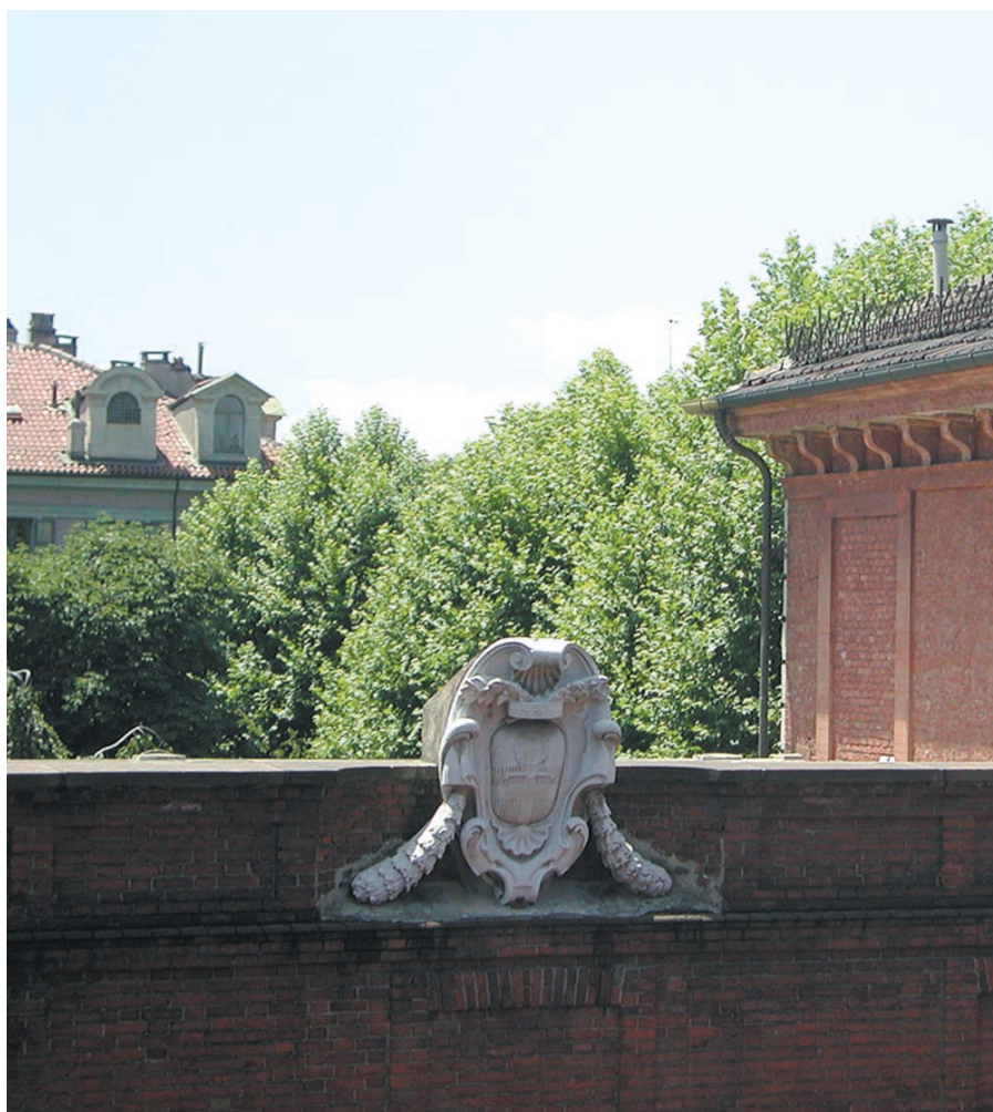
Particolare di Palazzo Cisterna

Acqua, emergenza dietro l'angolo Alberghi con marchio di qualità Traffico limitato al Nivolet