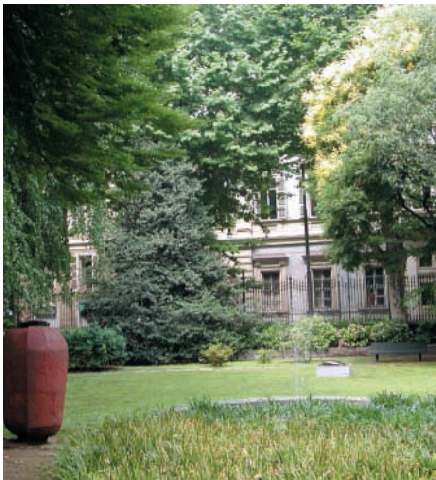
Arte a Palazzo Cisterna