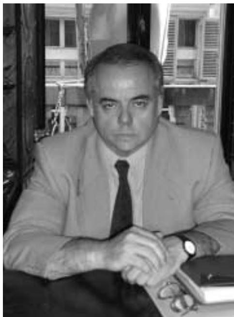
Il difensore civico Giorgio Gallo

L'Ufficio della Presidenza del Consiglio, nell'intento di presentare la figura del difensore civico e il servizio rivolto ai cittadini che intendono avvalersene, ha programmato una serie di incontri che si svolgeranno presso la sede dei Circondari, con inizio alle 10, nei seguenti giorni: 26 giugno ad Ivrea, 27 giugno a Lanzo Torinese, 2 luglio a Susa, 3 luglio a Pinerolo e 4 luglio a Palazzo Cisterna.