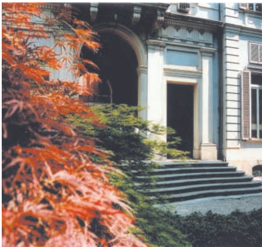
Scorcio di Palazzo Cisterna

Torino-Lione, Bresso a Parigi Remando da Torino a Venezia Circonvallazione di Venaria e Borgaro