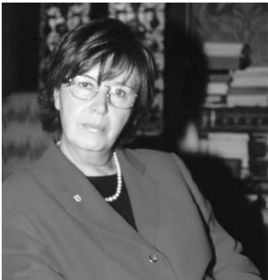
La presidente Mercedes Bresso