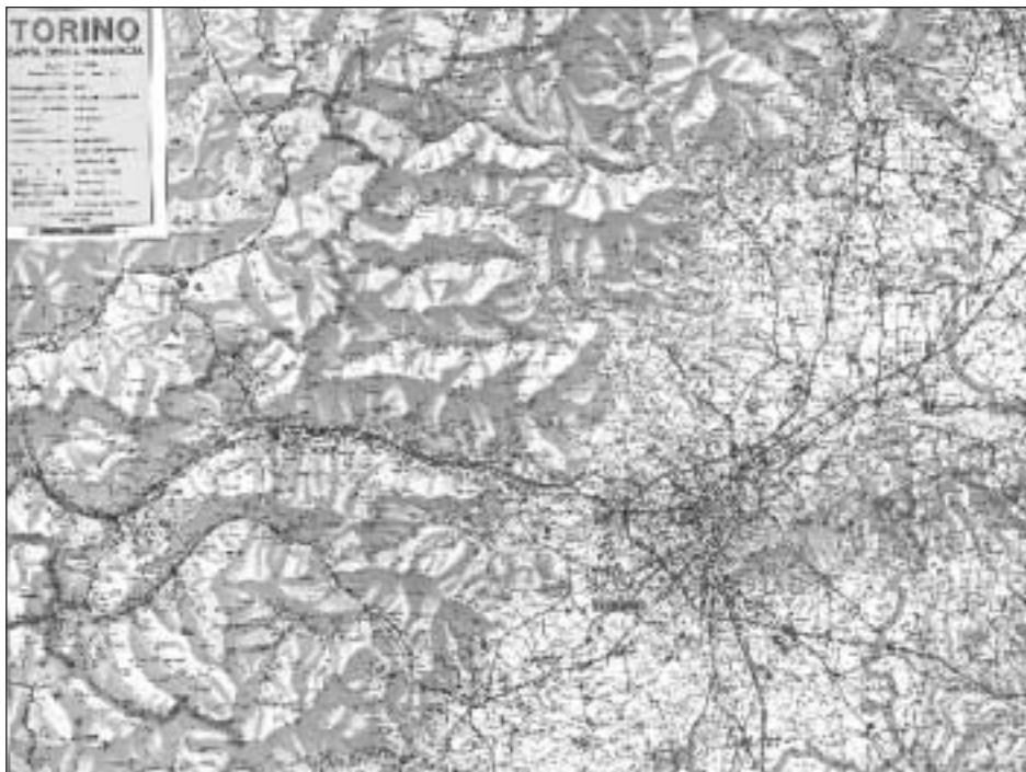
La provincia di Torino

si sono dichiarati favorevoli all'introduzione di due ore settimanali aggiuntive nei programmi scolastici dedicate ad attività inerenti l'ambiente. Per poter trattare in maniera esaustiva gli argomenti si è limitata la proposta a tre percorsi: aria, acqua, studio del paesaggio. Ognuno di questi è stato articolato in un modulo specifico (a scuola di territorio) e in un modulo comune (cartografare l'ambiente). Dopo l'acquisizione