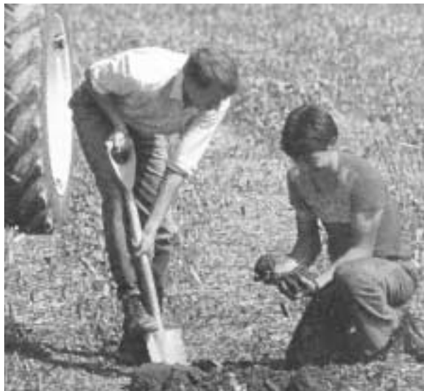
Giovani agricoltori