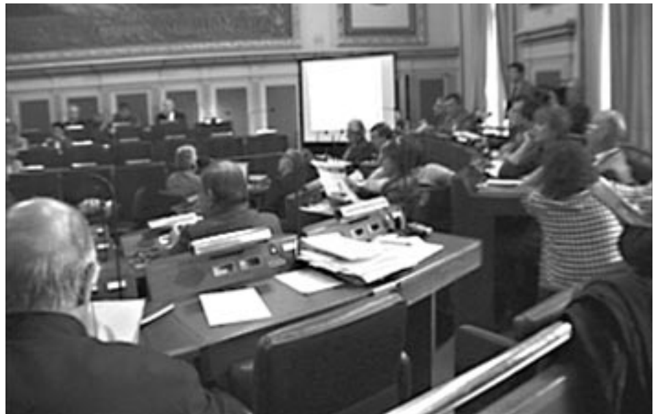
Nell'aula del Consiglio provinciale