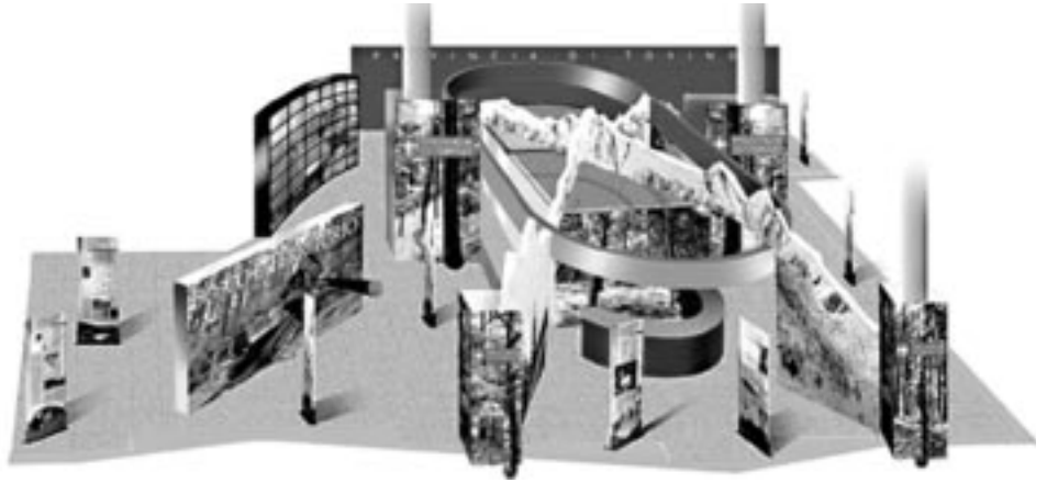
Lo stand della Provincia

2006" sono presenti nello stand, per far conoscere ai loro coetanei il progetto di volontariato e di cittadinanza attiva di cui sono i protagonisti.