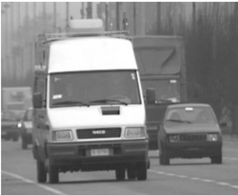
Traffico sulla strada provinciale

Sino al 16 ottobre, la Strada Provinciale 4 di Baldissero Torinese, resterà chiusa al traffico dalle 8 alle 17,30 al Km. 4 + 950 (nel territorio del Comune di Baldissero), per lavori urgenti. Lo stabilisce un'ordinanza firmata dalla presidente della Provincia, Mercedes Bresso. La chiusura al traffico è motivata dalla necessità di ripristinare la carreggiata della Provinciale 4, danneggiata dai nubifragi dell'inizio di settembre. Il blocco del traffico non sarà in vigore domenica 13 ottobre. Le deviazioni sono segnalate in loco.