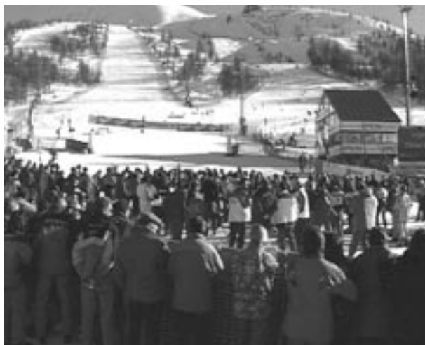
Campi di gara per le Olimpiadi 2006

La progettazione del servizio idrico - ovvero acquedotti, fognature e impianti di depurazione - nelle vallate coinvolte dalle Olimpiadi 2006 potrà finalmente essere avviata. L'Autorità d'ambito n. 3 "Torinese", presieduta da Mercedes Bresso, ha infatti firmato una convenzione con la Smat e con il Consorzio Acea che consentirà di far partire la progettazione preliminare in cinque comunità montane: Alta Valle Susa, Bassa Valle Susa, Val Chisone e