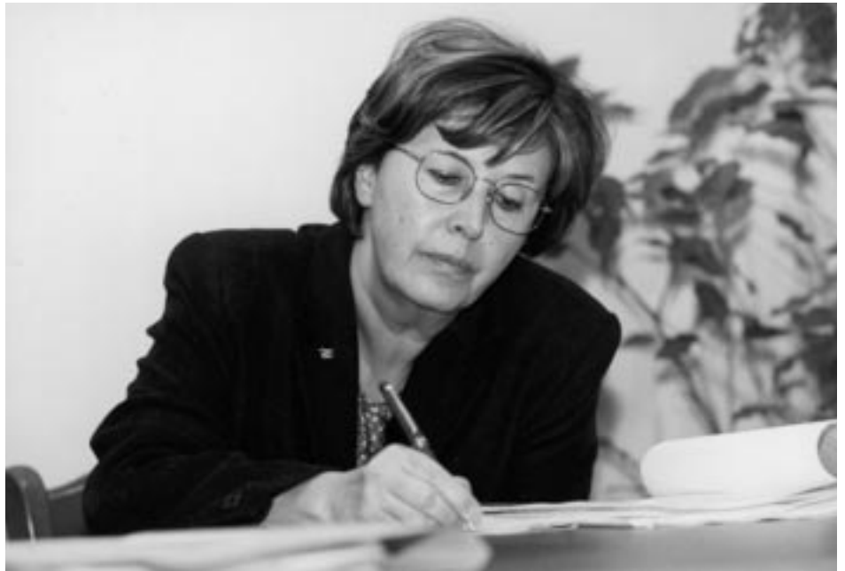
La presidente Bresso

"La compartecipazione all'Irpef - aggiunge Bresso - è poi un'autentica truffa. Formalmente ci viene concesso l'1 per cento dell'Irpef, ma nei fatti le Province dovranno accontentarsi della stessa cifra ricevuta lo scorso anno, decurtata del 2 per cento". "Da ultimo - sottolinea ancora Bresso - la beffa: le Regioni che non hanno rispettato il patto di stabilità ricevono le risorse che hanno chiesto; Province e Comuni che si sono messi in regola vengono puniti con norme chiaramente anticonstituzionali". "Per questo - conclude Bresso - non ci resta che ricorrere alla Corte Costituzionale. Penso di agire come semplice cittadina, visto che la legge impedisce alle Province di chiedere l'intervento dell'Alta Corte".