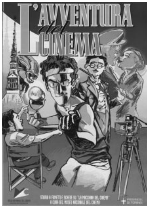
L'avventura del cinema