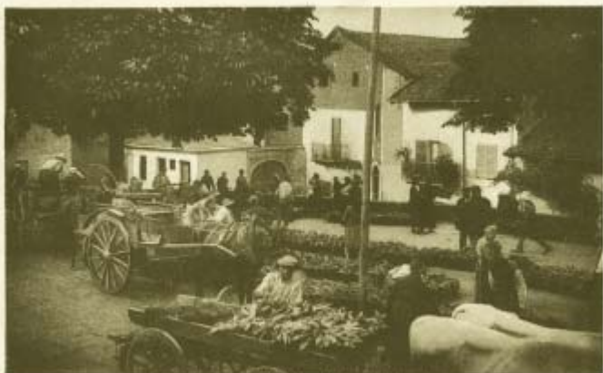
PECETTO TORINESE - Mercato della civioga