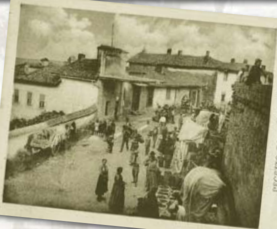
PECETTO TORINESE - Il mercato