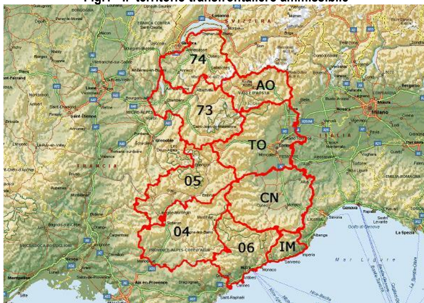
Fig.1 - Il territorio transfrontaliero ammissibile

Il programma farà ricorso alle possibilità previste dall'art. 20(2) del reg 1299/2013 per costruire dei progetti di qualità che coinvolgono partenariati nuovi per permettere lo sviluppo del territorio ALCOTRA. Si terrà conto dell'esperienza acquisita e dei partenariati sviluppati nei precedenti periodi di programmazione, in particolare con le capitali regionali e i territori precedentemente chiamati “adiacenti”.