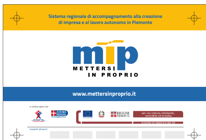
Sportelli area metropolitana di Torino