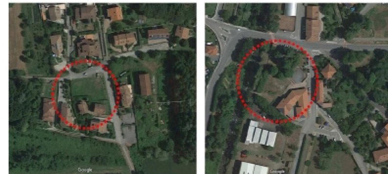
Viste aeree dei possibili lotto di intervento: a sinistra il Lotto 1 Armona, a destra il Lotto 2 Municipio

Richiesta di assistenza tecnica: 29/05/2018 Codice commessa attribuita: 1812A Presa in carico della commessa: 12/12//2018 | DVS 596-28736/2018 Trasmissione studio FATTIBILITA' 09/05/2019 Trasmissione prog. FATTIBILITA TEC: Approvazione prog. TATTIBILITA TEC: Autorizzazione FASE 2: Trasmissione progetto DEFINITIVO: NO Approvazione progetto DEFINITIVO: Trasmissione progetto ESECUTIVO: NO Approvazione progetto ESECUTIVO: Aggiudicazione definitiva dei LAVORI: Consegna dei LAVORI: Certificato di fine dei LAVORI: Certificato di COLLAUDO: Appr. Certificato di COLLAUDO: