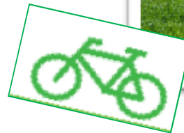
Parco Naturale Provinciale Rocca di Cavour