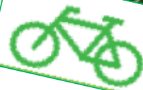
Parco Naturale Provinciale Rocca di Cavour