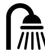
Lo spreco d'acqua