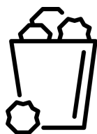
Spreco della carta