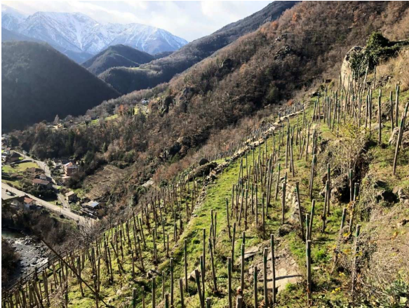
Le vigne sul ripido versante

giriamo a destra per raggiungere la SP169 e tornare al punto di partenza.