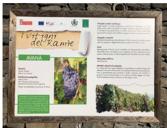
I pannelli didattici lungo il percorso

superando dei terrazzamenti. Attraversiamo una mulattiera, seguendo i segnavia bianchi e rossi, arriviamo a una strada forestale dove giriamo a sinistra, e dopo 100 m riprendiamo il sentiero sulla destra. Se invece proseguiamo dritto entriamo nel bosco e arriviamo alla stazione di partenza dell'adrenalinico "Volo del Dahu", la fune che attraversa per 800 m la valle, a un'altezza che arriva a 150 m.