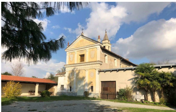
Il Santuario di Misobolo

un grande campo dove giriamo a sinistra e subito a destra, e al bivio a T giriamo a destra per una carrareccia tra i campi. Al successivo bivio a T giriamo a sinistra imboccando un sentiero in salita verso le vigne, che costeggiamo sulla destra fino ad arrivare a una carrareccia che costeggia un muro a secco e arriva su una strada asfaltata, dove giriamo a sinistra verso il vicino abitato di San Grato.