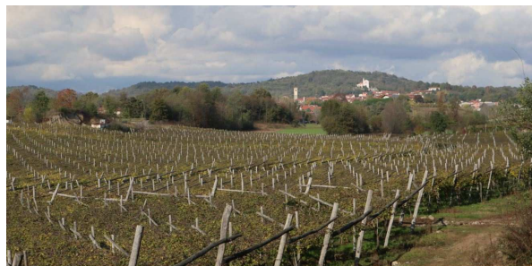
Panorama tra le vigne

quando un primo nucleo venne costruito dalla famiglia canavesana dei San Martino, e che venne trasformato nell'elegante residenza attuale tra il XVII e il XIX secolo. Negli ultimi anni il castello è stato usato come ambientazione per le serie televisive Elisa di Rivombrosa e La bella e la bestia, ed è visitabile per tutto l'anno, tutti i giorni tranne il lunedì.